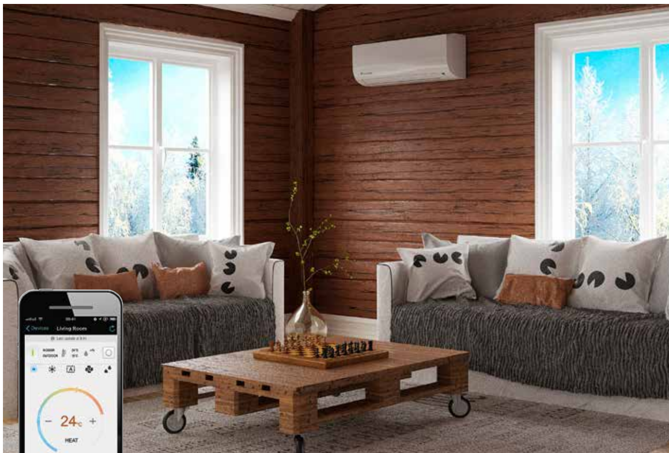
Daikin Comfora-luftvärmepumpen passar också bra för att värma upp stugan och hålla underhållsvärmen.